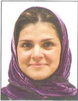
Foto con velo corretta