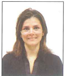
Montatura che taglia gli occhi