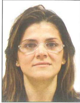
Foto con occhiali corretta