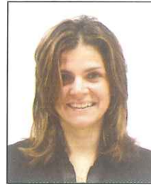
Capelli sugli occhi