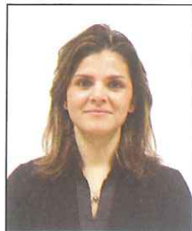
Posizione non corretta