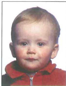
Foto bambino corretta