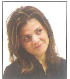
Occhi non orizzontali (viso inclinato)