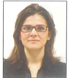
Montatura troppo pesante